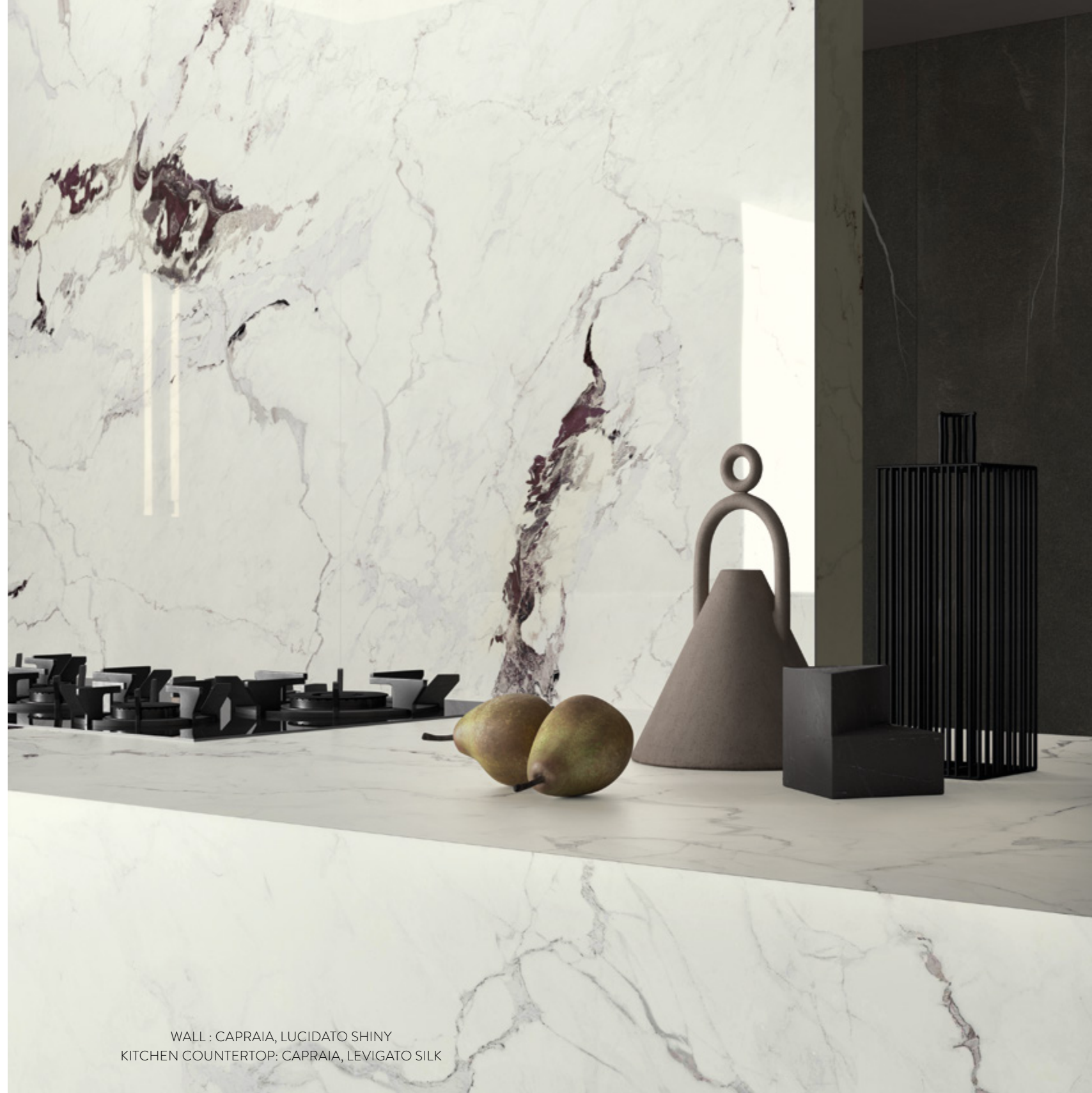
WALL : CAPRAIA, LUCIDATO SHINY KITCHEN COUNTERTOP: CAPRAIA, LEVIGATO SILK

ULTRA con il suo spessore 6 mm nativo, garantisce leggerezza e resistenza per tutte le applicazioni, anche quelle a cui non avevi pensato. Thanks to its native 6 mm thickness, ULTRA provides lightness and strength in all applications - even the ones you'd never even imagined.