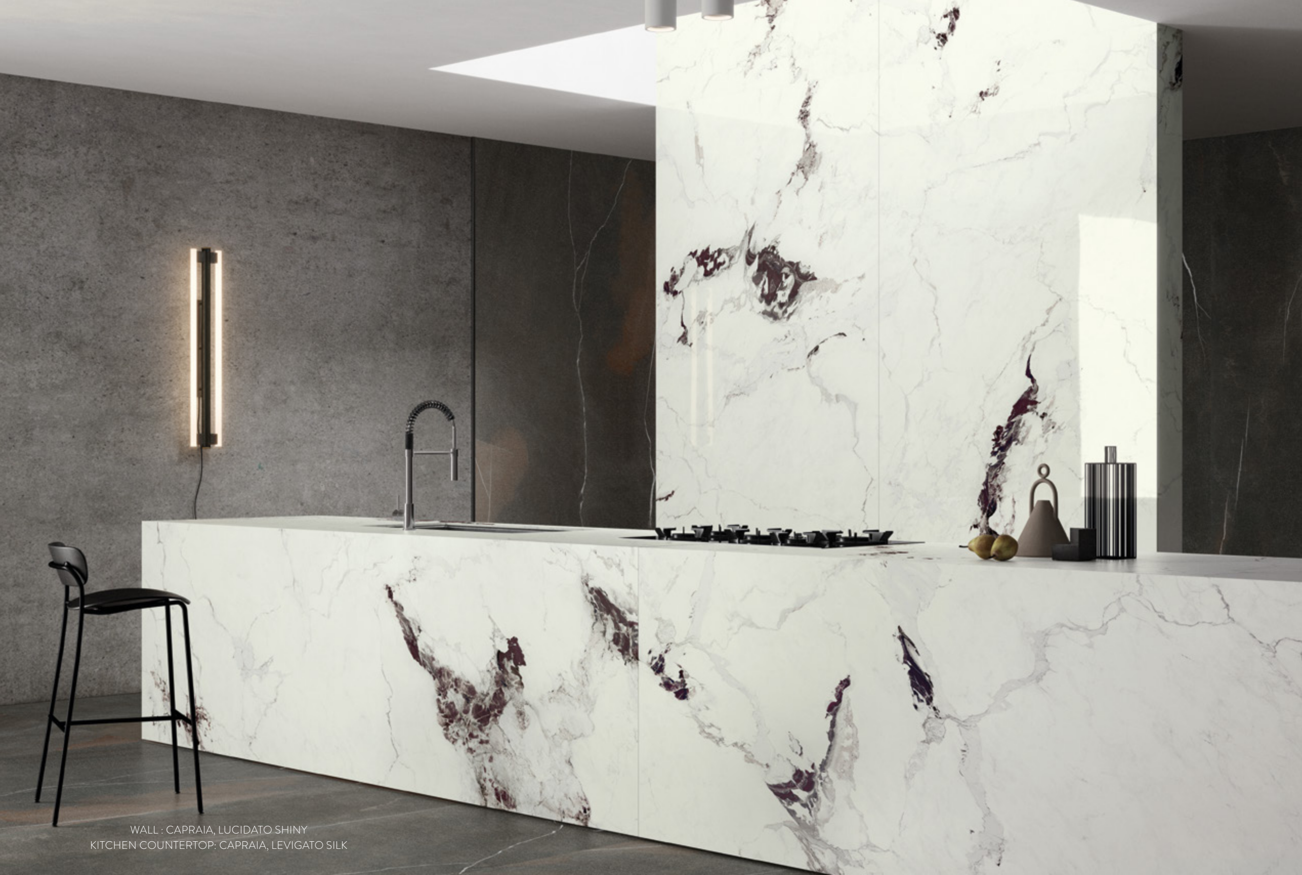
WALL : CAPRAIA, LUCIDATO SHINY KITCHEN COUNTERTOP: CAPRAIA, LEVIGATO SILK